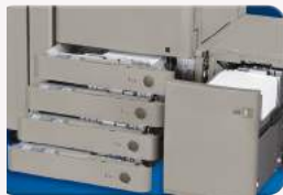
Acceso al papel mediante un botón