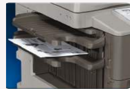
Finalizador interno con perforación de orificios